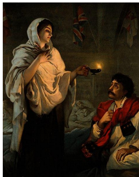
Florence Nightingale với cây đèn dầu bờn giường bệnh.