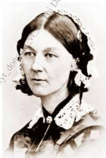
Florence Nightingale 12/5/1820 – 13/8/1910

Ngày Quốc tế Điều dưỡng hằng năm được các nước trên thế giới tổ chức vào ngày 12 tháng 5, ngày sinh của bà Florence Nightingale, nhằm tưởng nhớ những cống hiến to lớn của bà đối với việc hình thành và phát triển của ngành điều dưỡng hiện đại cũng như sự ghi nhận, tôn vinh của xã hội về vai trò của người điều dưỡng trong chăm sóc con người đặc biệt là chăm sóc người bệnh.